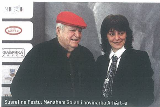
Susret na Festu: Menahem Golan i novinarka ArhArt-a

Golan ne prestaje da radi. Dovršava pripreme za film koji će snimati ovog leta. Otkriva nam da je reč o priči o Golemu, legendi koja datira iz Praga iz 16. veka, kada su tamošnji Jevreji bili izloženi pogromu. Po Kabali, Golem je bio div napravljen od gline sa obala Vltave, kome je praški rabin čarobnim hebrejskim rečima udahnuo život. Njegov zadatak bio je da štiti Jevreje. Ali, stvari su se otele kontroli...Puno je verzija o Golemu, ali Golan će se držati Kabale. I svog večnog obrasca - da dobro na kraju mora da pobeđi.